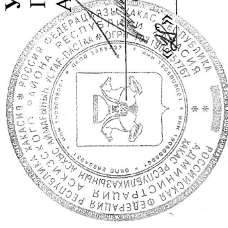
ГРАФИК проведения сельскохозяйственных ярмарок на территории Аскизского района в 2024 году